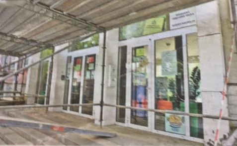
Súkromná základná škola sídli v budove Základnej školy v Ružovej doline.